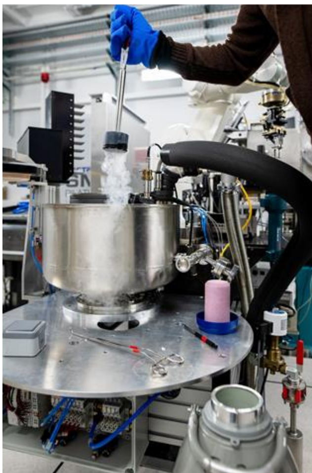
Chargement d'échantillons par l'utilisateur de la ligne de lumière synchrotron BM07-FIP2

Porté par les unités mixtes de recherche IBS, MEM et Symmes de l'Irig, ainsi que par l'Institut Néel et l'OSUG, ce projet va permettre une mise au meilleur niveau des infrastructures françaises d'investigation aux rayons X durs. La communauté académique et industrielle française pourra ainsi accéder dans les meilleures conditions à la nouvelle source synchrotron de quatrième génération de l'ESRF, via les 5 « Collaborative Research Groups » français dont 2 sont gérés par l'IBS et par MEM. Cette mise à niveau débutera en 2021 et se poursuivra jusqu'en 2025, en maintenant l'accueil des projets sur ces lignes existantes.