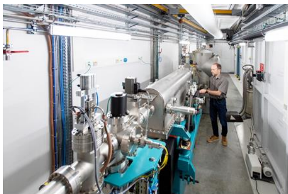
Intérieur de la cabane optique de la ligne de lumière synchrotron BM07-FIP2