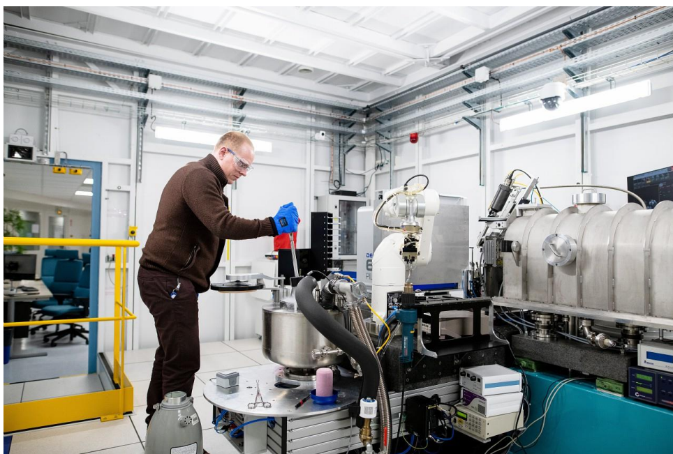
Chargement d'échantillons par l'utilisateur de la ligne de lumière synchrotron BM07-FIP2